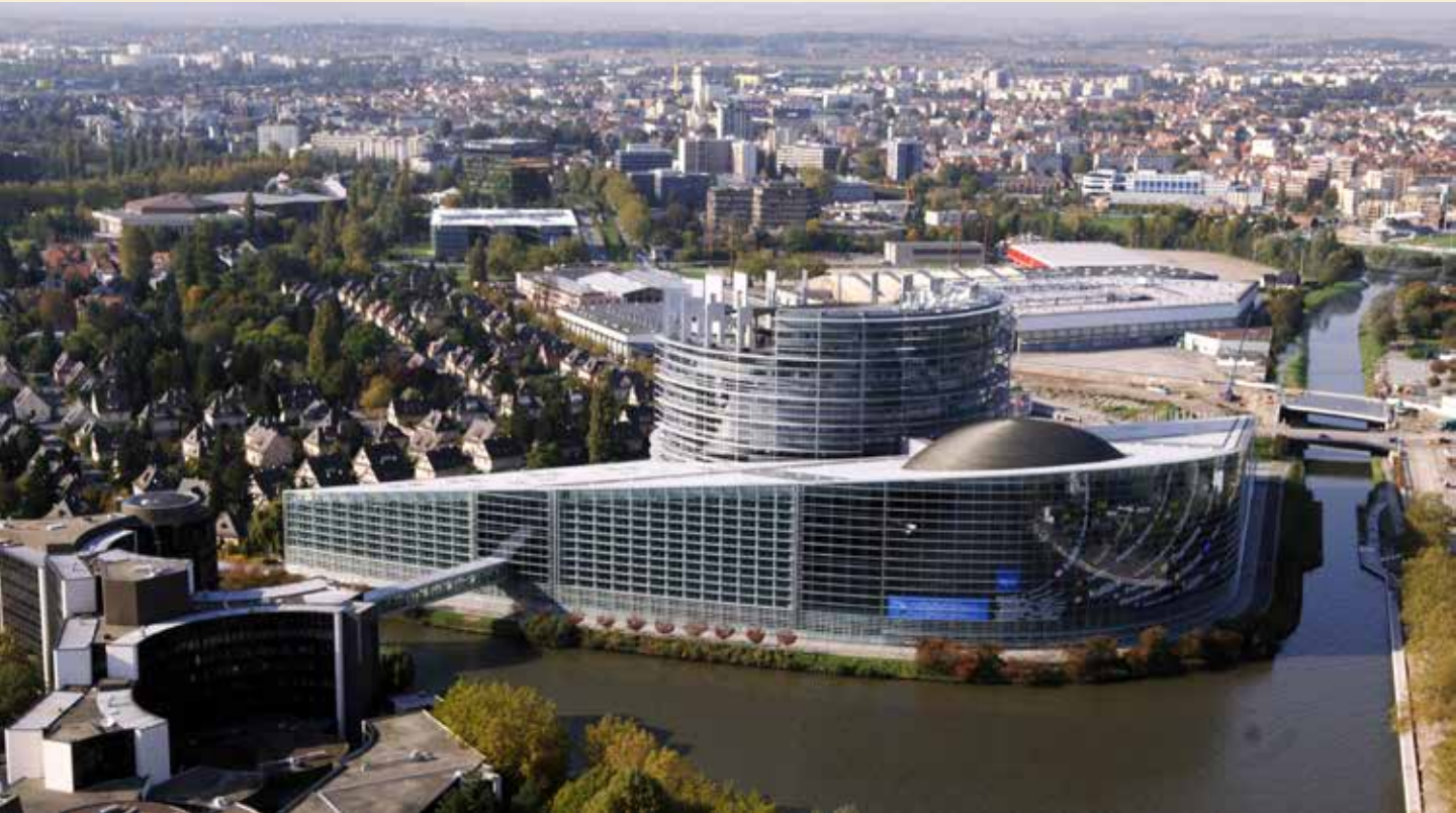
Europees Parlement Brussel