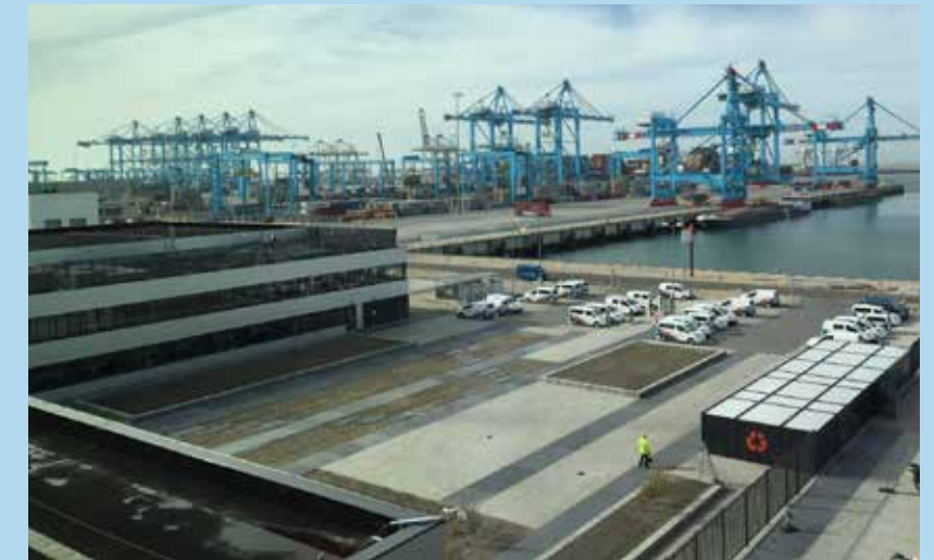
APM Terminals 2e maasvlakte, foto's: © J. Hartman